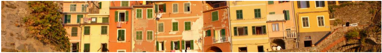
Colori della Liguria

Prima colazione in albergo e partenza, con un mezzo private, per Isolabona dove si potrà effettuare un'altra degustazione del pregiato olio in un'Azienda locale. Visita dei villaggi di Dolceacqua e Apricale. Pranzo in un ristorante lungo la strada. Partenza per Torino passando attraverso il Col di Tenda. Arrivo a Torino in albergo, tempo a disposizione. Cena in un ottimo ristorante del centro e rientro in albergo per il pernottamento.