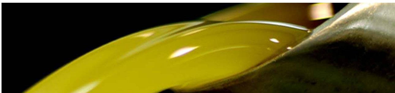
Liguria- il famoso olio di oliva

Prima colazione in albergo e partenza con un mezzo privato per la Liguria attraverso il Col di Nava. Gli ospiti saranno colpiti dal panorama e dai caratteristici villaggi e potranno sostare in Borghetto d'Arroschia, a Dolcedo e a Badalucco per scoprire e assaggiare il delizioso olio di oliva tipico di questa Regione. Pranzo in un ottimo ristorante lungo la strada. Durante il tour si potrà assaggiare la tipica focaccia ligure e il meraviglioso Pesto. La giornata terminerà a Ventimiglia giusto in tempo per una breve visita della città e del suo centro. La cena sarà tutta a base di pesce e gli ospiti rientreranno in albergo dopo aver assaggiato le specialità a base di pesce locali.