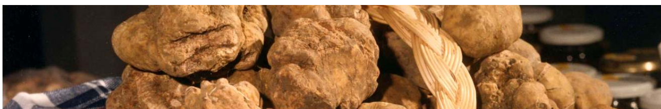
Le Langhe - Tartufi bianchi