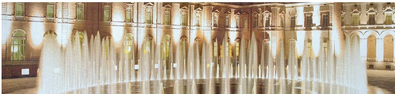
Torino - Reggia di Venaria

Colazione in albergo, incontro con la guida di Cube nella hall. Trasferimento con un mezzo privato da Eataly, il più importante supermercato italiano di cibo e bevande dove è possibile apprezzare il cibo di alta qualità. Pranzo in un ristorante stellato Michelin all'interno di Eataly. Al termine trasferimento con un mezzo privato al Museo del Cinema, situato all'interno della mole Antonelliana, per la visita guidata e per l'ascensione sulla Mole per godere della splendida vista su tutta la città e le Alpi. Breve passeggiata nelle vie centrali e quindi trasferimento, con mezzo privato, alla Venaria Reale. Visita della magnifica residenza sabauda e dei suoi giardini. Aperitivo e cena in un ristorante stellato Michelin che ha sede all'interno della Reggia. Rientro in albergo e pernottamento.