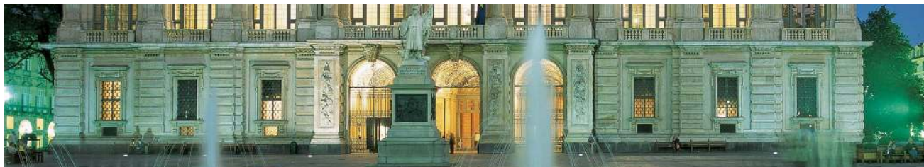
Torino - Palazzo Madama

Arrivo all'Aeroporto di Torino e trasferimento all'albergo. Appuntamento con lo staff di Cube nella hall dell'albergo per avere un breve briefing. Pranzo in un caffè storico in centro città. Dopo pranzo, con una guida privata inizio della visita a piedi del Quadrilatero romano con i suoi negozi storici (cioccolato, antiquari, pasticcerie, vinerie), i negozi di tendenza e le tipiche gastronomie piemontesi con le loro eccellenze. Incontro con la famosa cioccolata calda e ritorno in albergo. Aperitivo con assaggi di vini locali. Al termine cena in un conosciuto ristorante stellato Michelin. Pernottamento